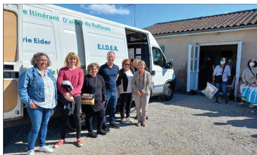
Les membres du Département de la Gironde et de l'association La Boussole du Médoc, à la distribution de Verteuil, lundi.

chargés de mission et conseillers en économie sociale et solidaire et développement territorial du département de Gironde avaient aussi fait le déplacement. Aller au plus près des futurs bénéficiaires de l'aide alimentaire réclame une solide organisation, une logistique importante, et pas mal de manutention. Ça tombait bien, les débuts de semaines de distribution, l'activité ne manque pas à Eider. La Boussole Médoc a ainsi pu voir ce qui l'attend, dès qu'elle aura pris possession dans quelques semaines du camion qui servira aux tournées. C'est la seconde fois en un an qu'Eider reçoit la visite d'une future épicerie solidaire itinérante de Gironde.