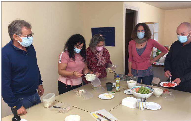
La préparation d'un repas équilibré était au menu du dernier atelier hier mercredi à Nanteuil, avant une marche et un pique-nique.